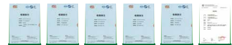
热原测试 体外细胞毒性测试 急性全身毒性试验 皮内刺激试验 致敏测试 提取物测试

CellSafe™系列产品经第三方检测机构检测表明, 可提取物、生物相容性、生物安全性等均符合《中国药典》、ISO、USP等系列标准, 无菌水平达SAL 10 -6 , 无致敏性、无溶血、无热原、无细胞毒性等。