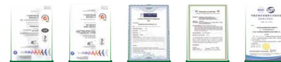
ISO 9001 ISO 13485 FDA CE CNAS

CellSafe™系列产品均严格按照GMP标准规范、ISO 13485、ISO 9001、CE、FDA、CNAS要求实施严苛的生产及质量检测管控, 每批产品均能实现“原料-生产-质检-包装-灭菌-放行-运输-签收”全流程标准管理, 以保证每批产品的高一致性、高溯源性。